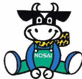
農業共済新聞マスコット 「ノーサイくん」