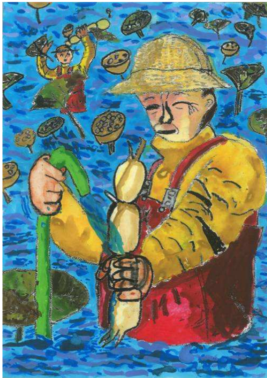
第11回「農」絵画コンクール県知事賞（3年生） 「レンコンのしゅうかく」

『農』絵画コンクールは、自然とのふれあいを通じて、 農業の大切さを実感してもらうことを目的としています。