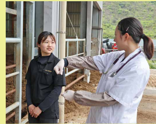
牛舎の環境などの指導も行います

牛も人と同じように、日々の健康管理が大切です。その一つが「代謝プロファイルテスト(MPT)」です。これは、血液検査やボディコンディションスコア等を用いて牛の健康・栄養状態を「見える化」し、客観的に評価するものです。例えば乳用牛では、分娩前後の栄養不足やエネルギー代謝の乱れが産乳量や繁殖成績、周産期疾患