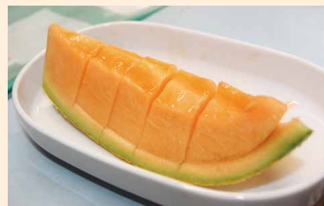
柔らかい果肉からあふれ出す甘みが口の中いっぱいに広がります

今はインターネットや直売所が普及して販路の選択肢も増えていきます。売れるのは一番楽しいですが、お客さまに喜んでもらえる商品を作る楽しさを大切にしていきたいです!