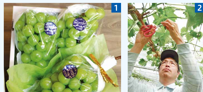
1 園内全てのブドウが「ひょうご推奨ブランド」に認証されています。現在、10品種を栽培中です 2 「余分な房を落とすことで適切な着果量になり、樹が傷むのを防げます」と房落としを行う加門さん

就農当時、ブドウ栽培は未経験だったため、先進地や県内外の生産者、関係機関に技術を学びながら試行錯誤を繰り返して経営を続け、現在、連棟ハウス4棟で70 ア 栽培しています。教わる中で、他県の生産者が農業共済を利用していることを知りましたが、兵庫県はブドウの共済を実施しておらず、加入できませんでした。NOSAI職員の方から「ブドウも対象になる収入保険が