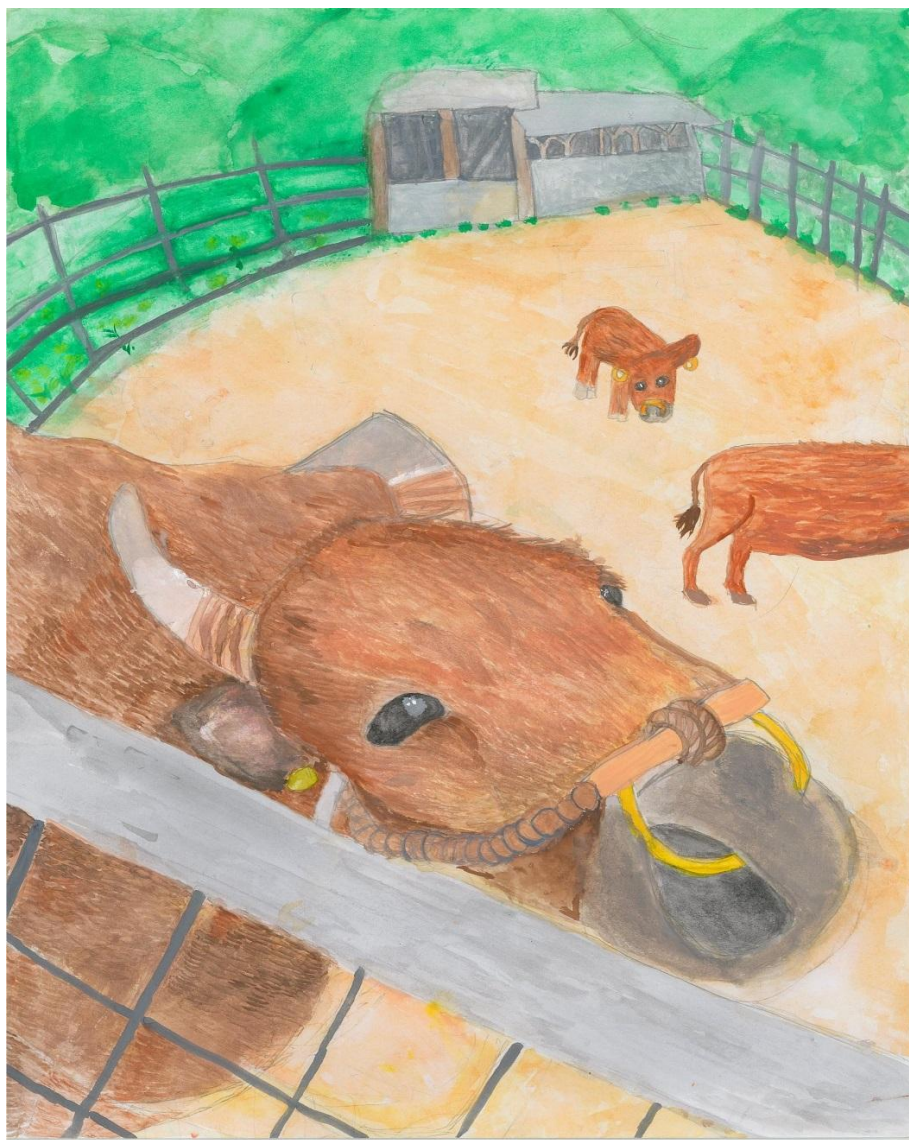
第24回『農』絵画コンクール