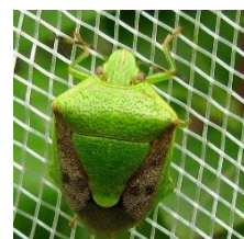
チャバネアオカメムシ

今後の気温が高いとカメムシ類が活発に活動するため、果実の肥大に伴う果実袋の上からの吸汁被害が懸念されます。チャバネアオカメムシ等のカメムシ類を見かけたら、適切に防除してください。