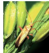
アカスジカスミカメ