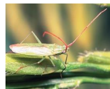
アカヒゲホソミドリカスミカメ

発行 ： NOSAIひょうご東播磨事務所 調査協力 ： JA全農兵庫 支援 ： 東播磨農業改良普及事業協議会（構成員：明石市、加古川市、高砂市、稲美町、播磨町、JAあかし、JA兵庫南、JA加古川南、加古川農業改良普及センター） お問合せ先 ： 加古川農業改良普及センター 地域課 電話 (079) 421-9354