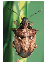
オオトゲシラホシカメムシ