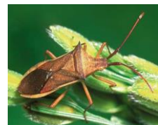
ホソハリカメムシ