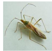
クモヘリカメムシ